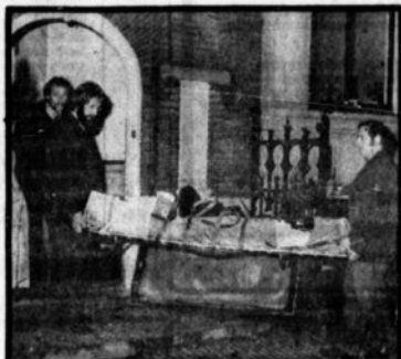
Twee maanden geleden werd het lijk van een jonge Duitser in een kraakpand gevonden. Heroïne...

Dit is het eerste deel van een grote reportage over heroïne. Een hard drug. Tot voor kort onbekend in Nederland. Nu al duizenden verslaafden.