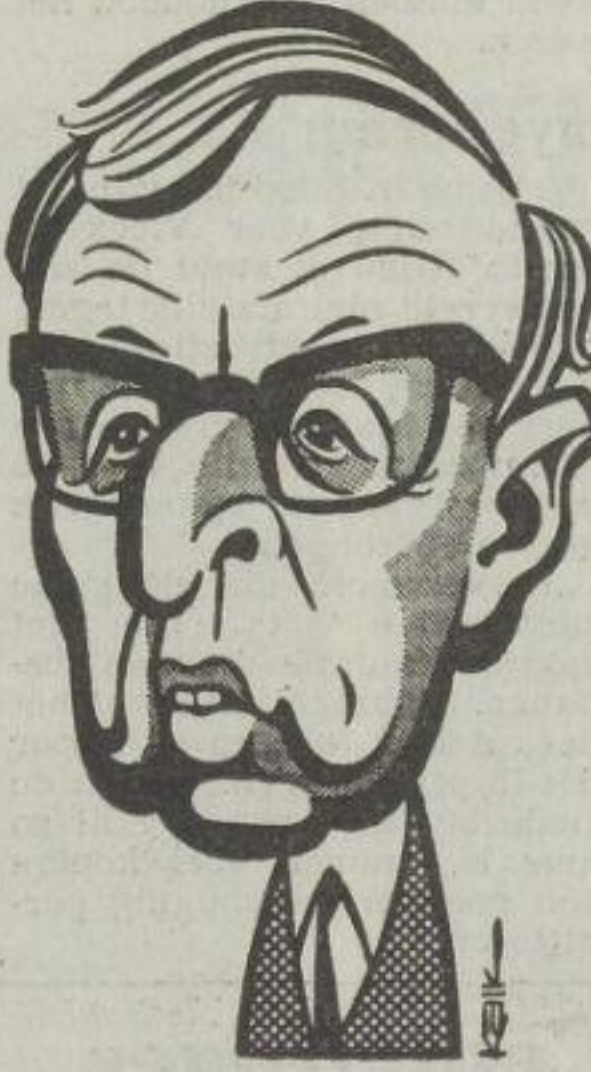
Dr. J. Zijlstra: geen „officieel“ contact met Van Agt.

Verder wil hij meer bezuinigen. In zijn fractie heeft hij zich daarbij beroepen op partijgenoot Zijlstra, die het sociaal-economische program