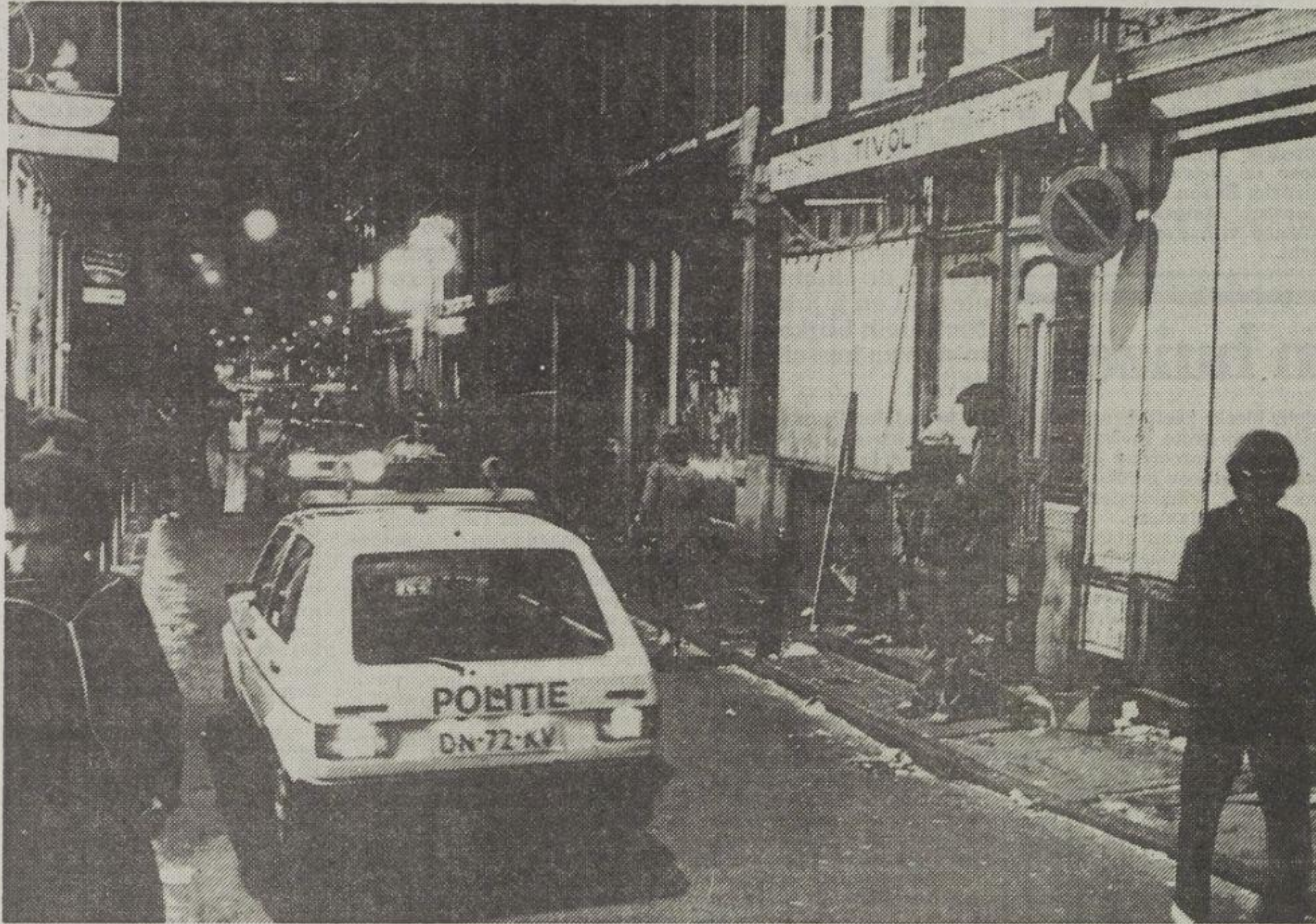
De Amsterdamse Zeedijk: strenger politietoedredde tegen heroïne-overlast.

Medische verstrekking van heroïne is volgens de MDHG de enige manier om de problemen op te lossen en de verslaafde een menselijker bestaan te bieden.